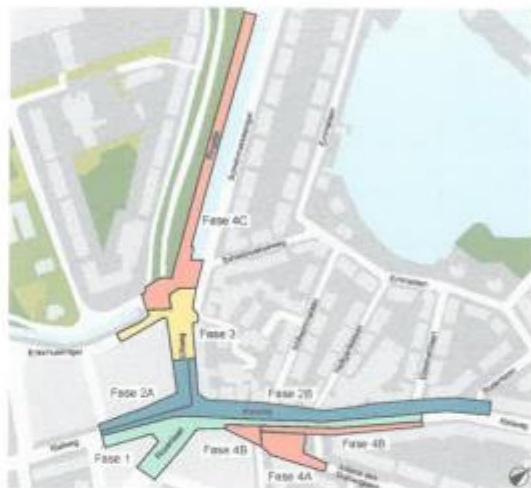
Weeknummers zijn indicatief

Op deze afbeelding zijn de faseringen van het werk aangegeven. Door omstandigheden of slecht weer kunnen werkzaamheden uitlopen.